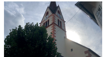
Markuskirche, Ortszentrum