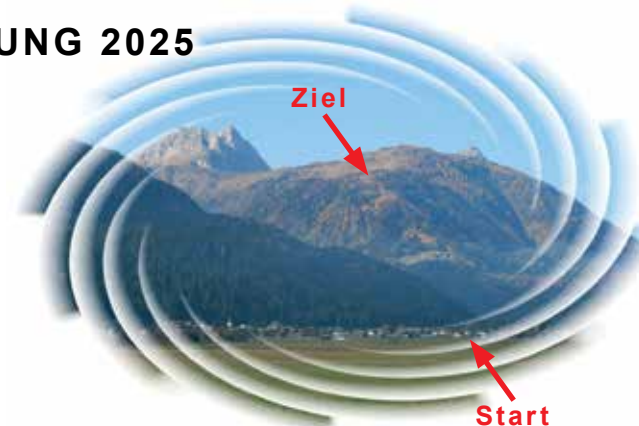
Streckenprofil "Mauthner Alm-Berglauf"